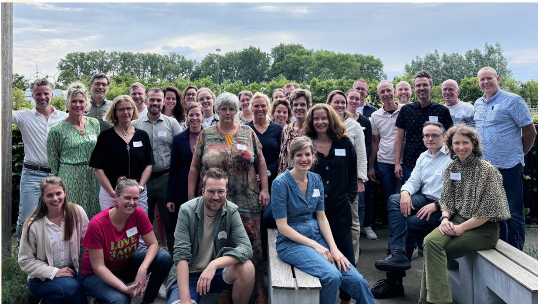
Beeld: Medewerkers en vrijwilligers tijdens de landelijke ANDERS NL dag in 2024

Het bestuur komt gemiddeld maandelijks samen met de directeur om de voortgang van de werkzaamheden, de koers en de strategie te bespreken.