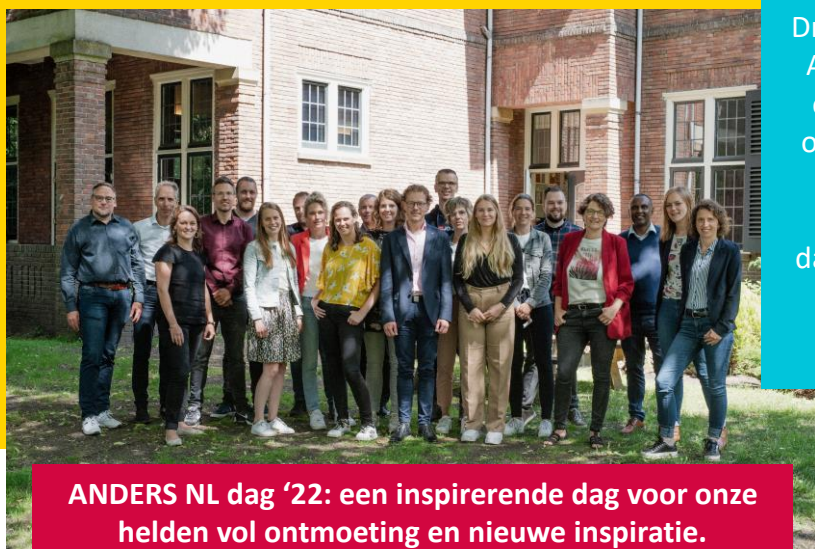
ANDERS NL dag '22: een inspirerende dag voor onze helden vol ontmoeting en nieuwe inspiratie. Klik hier voor meer foto's.

Met 7 lokale stichtingen in Drechtsteden, Rotterdam, Eindhoven, Amstelland, Nijmegen*, Den Haag* en Rivierenwaard* werken we aan onze droom om overal in Nederland ondernemers te verbinden aan de meest kwetsbare hulpvragen. Ook dagen we elke hulpvrager uit om een goede daad door te geven.