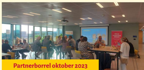
Partnerborrel oktober 2023

De impact die we, samen met onze 277 ondernemers, hebben kunnen maken in de levens van ruim 700 hulpvragers